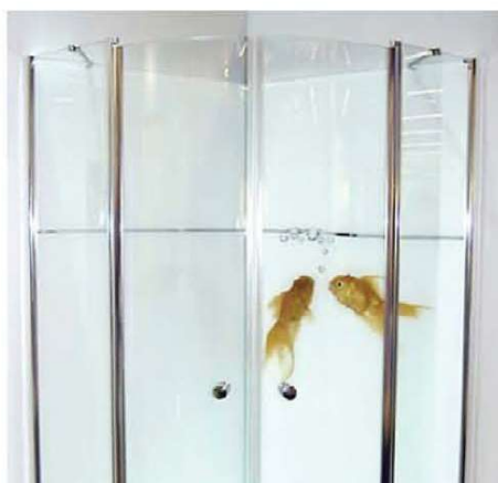
Digitalni print na staklo

Staklo tuš kabina može biti raznih boja, u većini slučajeva kaljeno (sigurnosno staklo) 8-10 mm debljine. Pjeskarena, stakla s lijepljenom folijom, satinirana, prozirna stakla u nijansama boja (parsioli). Nanosom keramičkih boja digitalnim printom dobijamo na staklu dopadljive slike koje daju višu dimenziju prostora. Koliko je važno da staklo bude sigurnosno, toliko je bitan i okov za staklo. Okov mora biti izrađen od kvalitetnog materijala, te mora zadovoljavati svim zahtjevima s kojima se susrećemo u kupaonici (visoka vlažnost, doticaj s vodom, itd.).